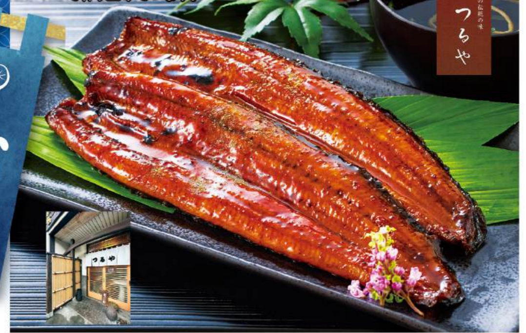
「浜名湖つるや」監修 浜松うなぎ長蒲焼セット(2尾)