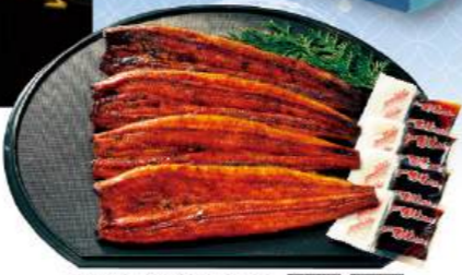
うなぎ長蒲焼4尾セット [0901] [0904]

浜松の老舗うなぎ店「浜名湖つるや」監修のうなぎ蒲焼です。厳選した浜名湖のうなぎのみを使用し、丹精込めて作り上げています。