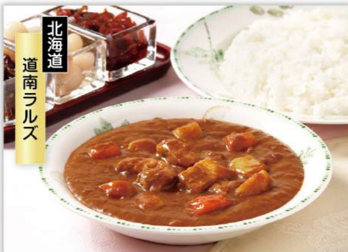
北海道 道南ラルズ

五島軒人気No.1の函館カレーシリーズ。定番の「中辛」から新商品の「シーフード」「じゃがいも」を詰め合わせたギフトセットです。