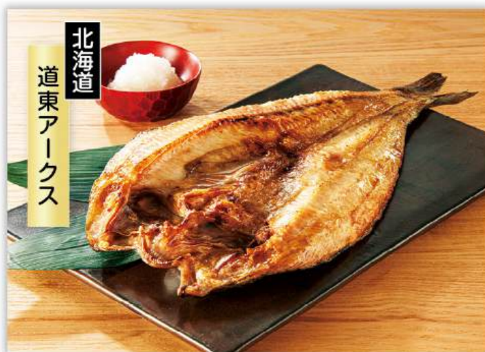
北海道 道東アークス

北海道産真ホッケを独自の「熟成製法」で手作りしています。両面ともホクホクとした食感を実現。脂乗りと食感にこだわりぬいたホッケをぜひご堪能ください。